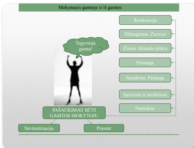
1 pav. Mokymosi Žaliosiose mokymosi aplinkose motyvacija