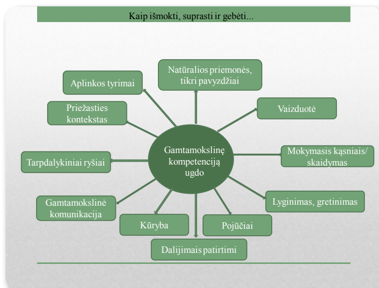
2 pav. Gamtamokslinės kompetencijos ugdymas Žaliosiose mokymosi aplinkose